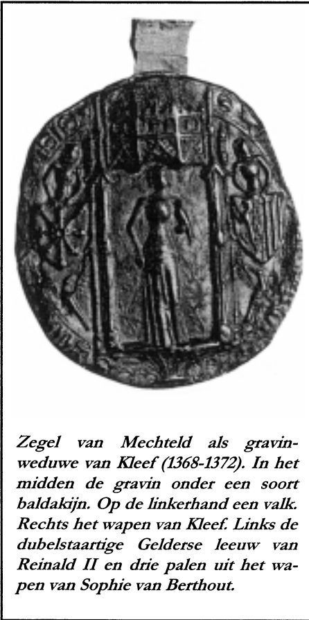
Zegel van Mechteld als gravin-weduwe van Kleef (1368-1372). In het midden de gravin onder een soort baldakijn. Op de linkerhand een valk. Rechts het wapen van Kleef. Links de dubelstaartige Gelderse leeuw van Reinald II en drie palen uit het wapen van Sophie van Berthout.

de slag bij Baesweiler nog steeds in Gulikse gevangenschap. (Maria van Brabant was al op 1 juli 1347 overleden.) Mechteld was voor de tweede keer weduwe na de dood van Johan van Kleef op 19 oktober 1368. Zijn opvolger, Adolf I, kleinzoon in vrouwelijke lijn van Derik VIII en Maria van Gelder, stond welwillend tegenover de ambities van zijn tante. Arent van Hoorn, bisschop van Utrecht en oom van Johan van Kleef beloofde in januari 1372 al dat hij der edelen hoechgeboern vrouwe, vrouwe Mech-