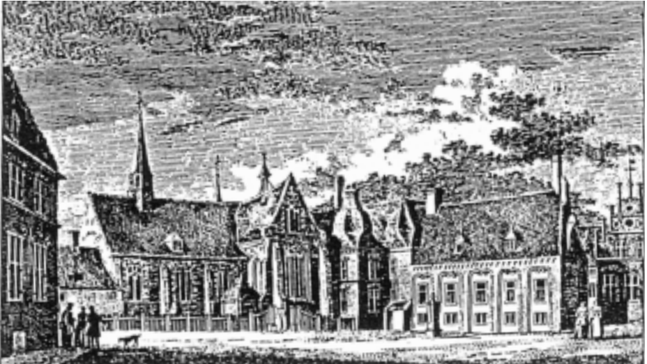
Gravendal bij Asperden was de laatste rustplaats van tal van Gelderse vorsten. Jan de Beijer maakte in 1744 deze gravure van het Stift.

En op de steun van de hertog van Gulik. Rentmeester Diederik van Lent was in 1347 burggraaf van Nijmegen geweest en op 6 december 1348 was hij aanwezig bij het afleggen van de eed van trouw aan Reinald door nieuwe door hem geselecteerde ministerialen die Bronckhorstgezinden moesten vervangen. In het rijtje Hekerens in 'Historia Gelria' worden naast Diederik van Lent, dominus de Buinsweerd o.m. Arent van Arkel, Jan van Kuilenburg, Walraven van Valkenburg en Zweder van Voorst genoemd. Johan van Kleef en Mechteld steunden de Hekerens. De steden Nijmegen en Tiel spraken zich uit voor Eleonora en voor Eduard als hertog. Om die rebellie de kop in te drukken en andere steden te weerhouden het Nijmeegse voorbeeld te