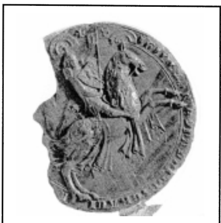
Zegel van Reinald II ná zijn verheffing tot rijksvorst in 1339.