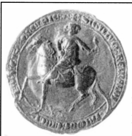
Zegel van de jonge graaf Reinald II. Op zijn linkerhand een valk. Dit zegel gebruikte hij waarschijnlijk tot zijn verheffing tot rijksvorst in 1339.

Gunstig gelegen in de delta van Rijn en Maas hadden de Gelderse steden zich in de 14 e eeuw voorspoedig ontwikkeld. De Gelderse Hanzesteden hadden de handel van Utrecht voor een belangrijk deel overgenomen en