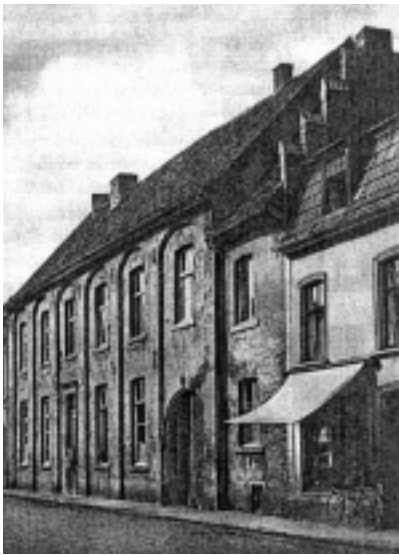
Het voormalige Hof van Gelder in de stad Geldern

omgeving van hun burchten plunderden en de plattelanders tot wanhoop brachten. In 1375 werd een landvrede gesloten om deze terreur het hoofd te bieden. Deelnemers aan deze landvrede waren de aartsbisschop van Keulen, de hertog van Brabant, de steden Keulen en Aken en Mechteld als hertogin van Gelder. De burchten van de roofridders in Linn, Dyck, Alphen, Reifferscheid en Griepskorn werden belegerd, ingenomen en verwoest. Op het verloop van de oorlog in Gelder hadden deze acties nauwelijks invloed. Nog eenmaal ontmoette Mechteld haar vele trouwe aanhangers op Allerheiligen 1376 bij de bezegeling van een zoenbrief en een landvrede door de ridders en knapen van de Veluwe en de Betuwe op slot De Horst van Arent van Hoorn. Daarin werd een voorlopige gebiedsindeling