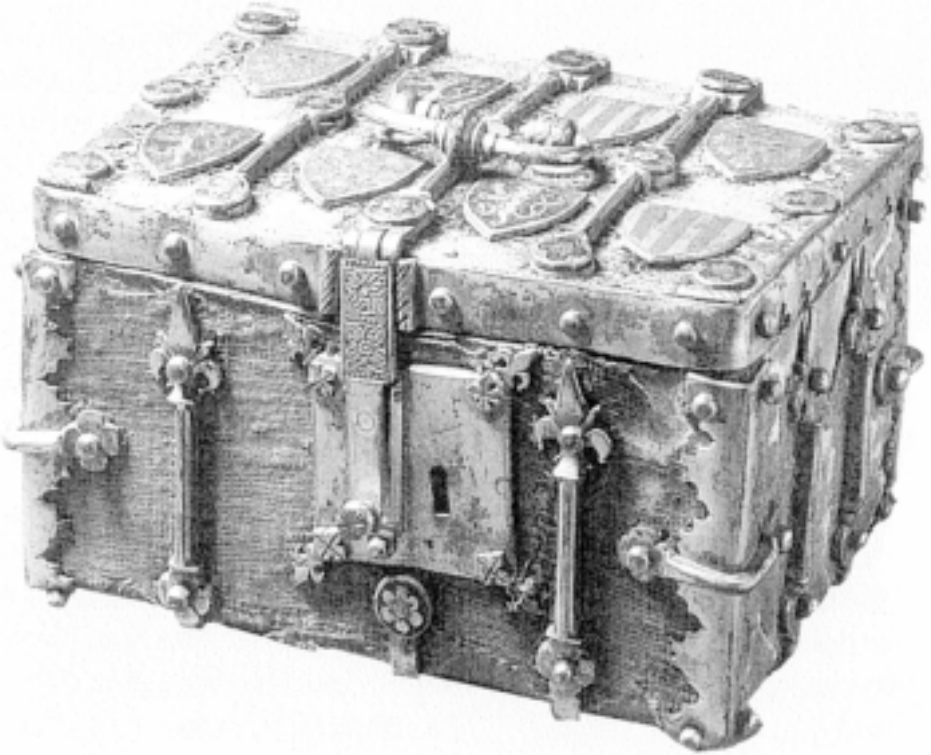
Het kleine juwelenkistje van Mechteld van Gelder draagt op het dekseltje de wapens van resp. haar vader, Reinald II, haar moeder, Sophie van Berthout en haar tweede echtgenoot, Johan van Kleef. Het houten kistje is aan de buitenzijde met zijde bekleed en aan de binnenkant met leer. Het koperbeslag is verguld. Kunstmuseum Düsseldorf.

volgen werd Nijmegen op 16 april 1350 geweldloos door de Hekerens ingenomen. Het recalcitrante Tiel werd op 24 augustus stormenderhand overweldigd. Iedereen gaat zich nu met iedereen in het Gelderse conflict bemoeien. Er volgt een zoen in 1352, een tweede verdrag in 1353 waarbij