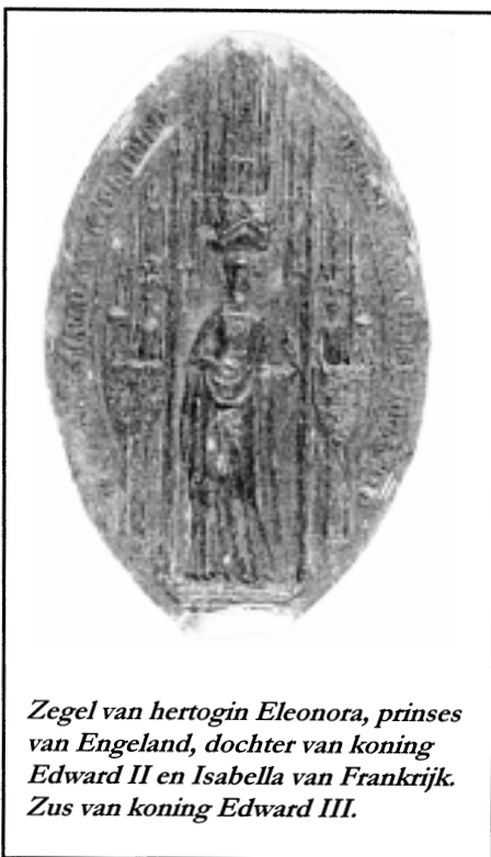
Zegel van hertogin Eleonora, prinses van Engeland, dochter van koning Edward II en Isabella van Frankrijk. Zus van koning Edward III.

het voorkomen van oorlog in zijn marktgebieden. Frankrijk was ver weg.