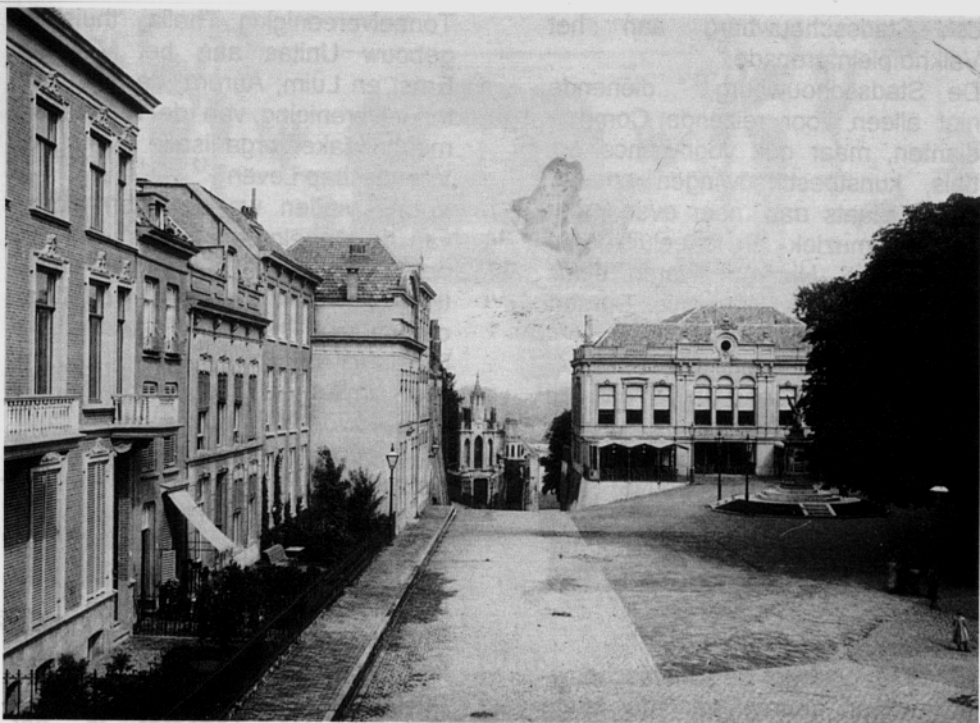
Valkhofplein ca. 1890 (foto W. Ivens) uit collectie Gemeentearchief Nijmegen. Rechts Sociëteit Burgerlust, later Unitas. Alleen het Spoorwegmonument bestaat nog.