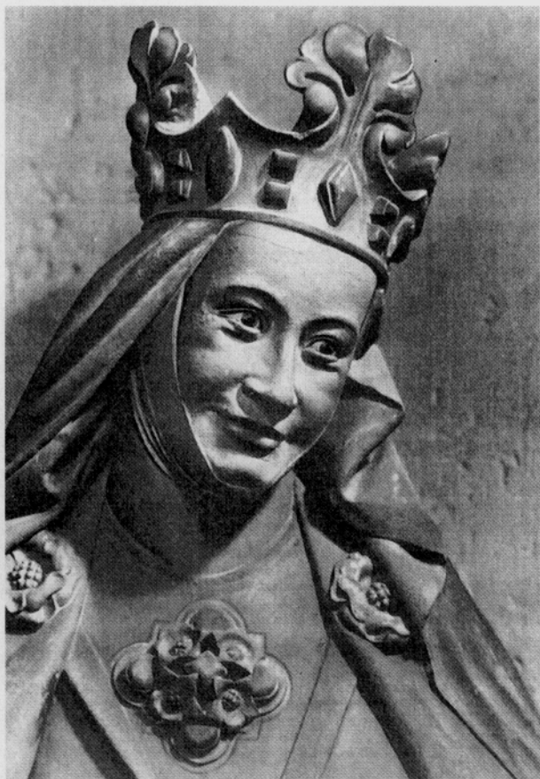
Een glimlachende Adelheid aan de koorwand van de Meissener Dom, vereeuwigd in een beeldengalerij met haar man Otto I (omstreeks 1270)

Naast de grote vrouwen voor Europa is zij een van de groten in de Europese geschiedenis die in de meest donkere tijden van het pausschap een bemoedigend licht liet oplaaien, dat tot het goede leidde (uit: Rheinische Post – maart 2000).