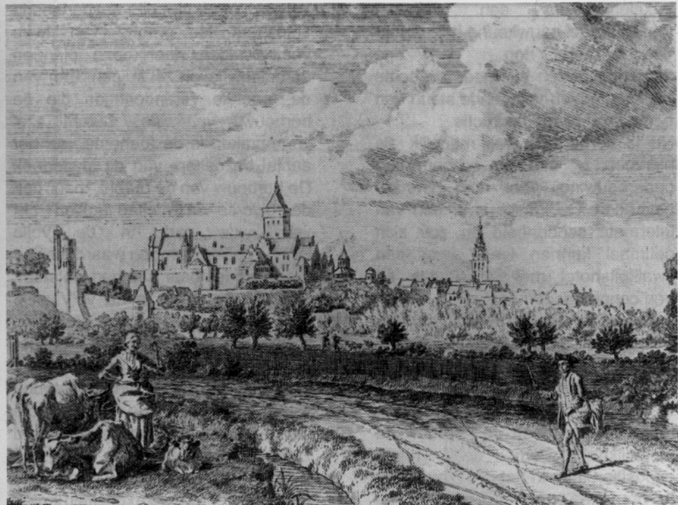
'Nimwegen uyt de Ooij te zien'. Ets van Hendrik Hoogers uit 1788 Collectie Museum Het Valkhof Nijmegen