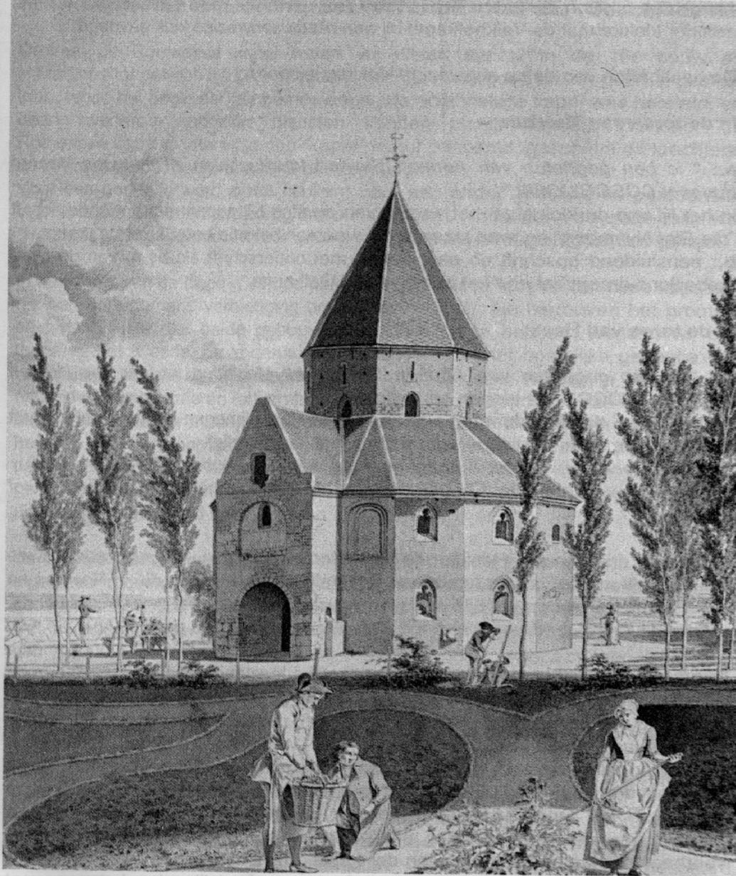
'De Heidensche complete Capel op 't Valkhof te Nijmegen in de tuin van den Hr. Roelofs getekent'. H.Hoogers 1809. Coll. Museum Het Valkhof Nijmegen