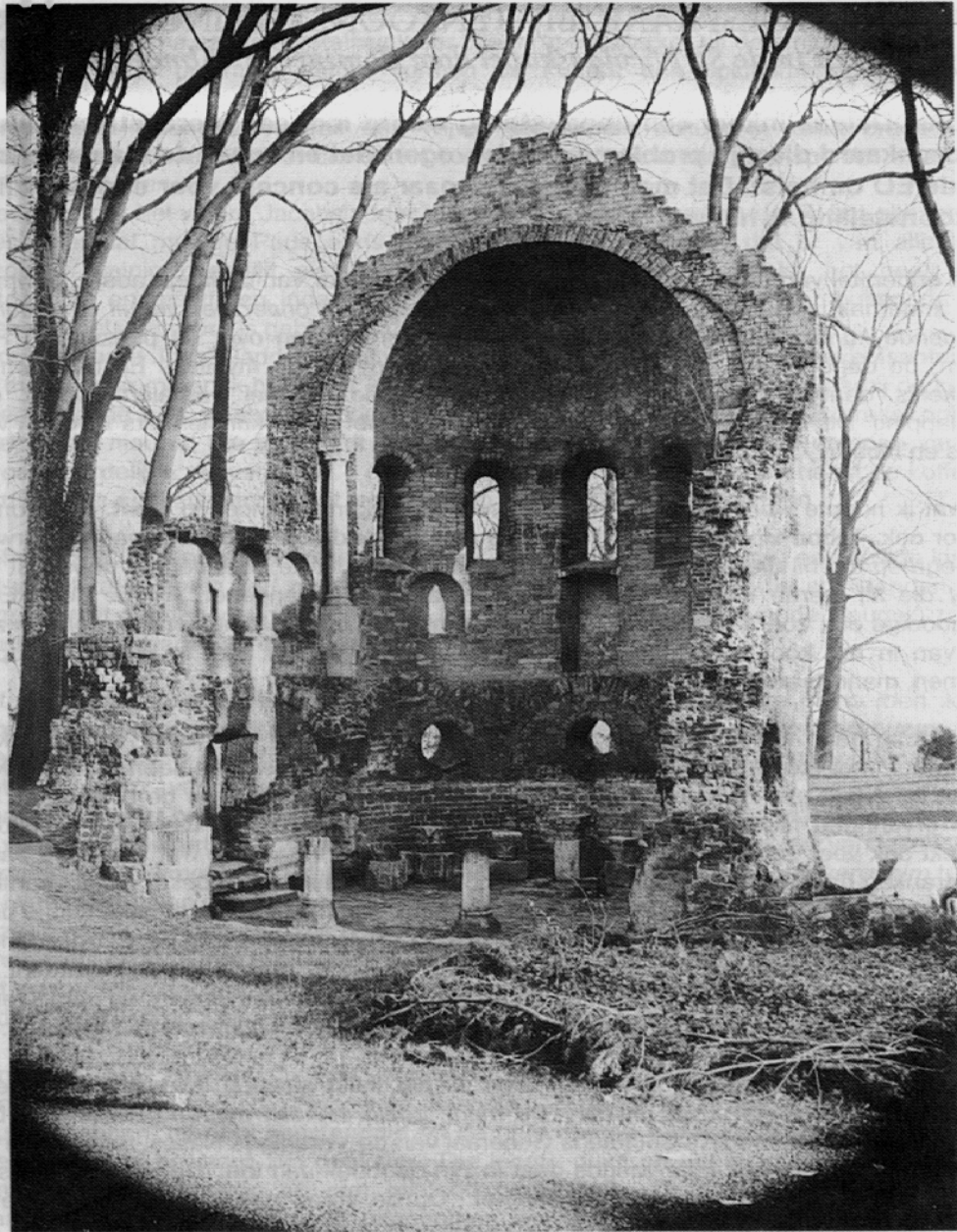
Barbarossa-ruïne na de restauratie van 1902 en de ontgraving in 1910-1911 Let op nog aanwezige brokstukken van pilaren en kapitelen