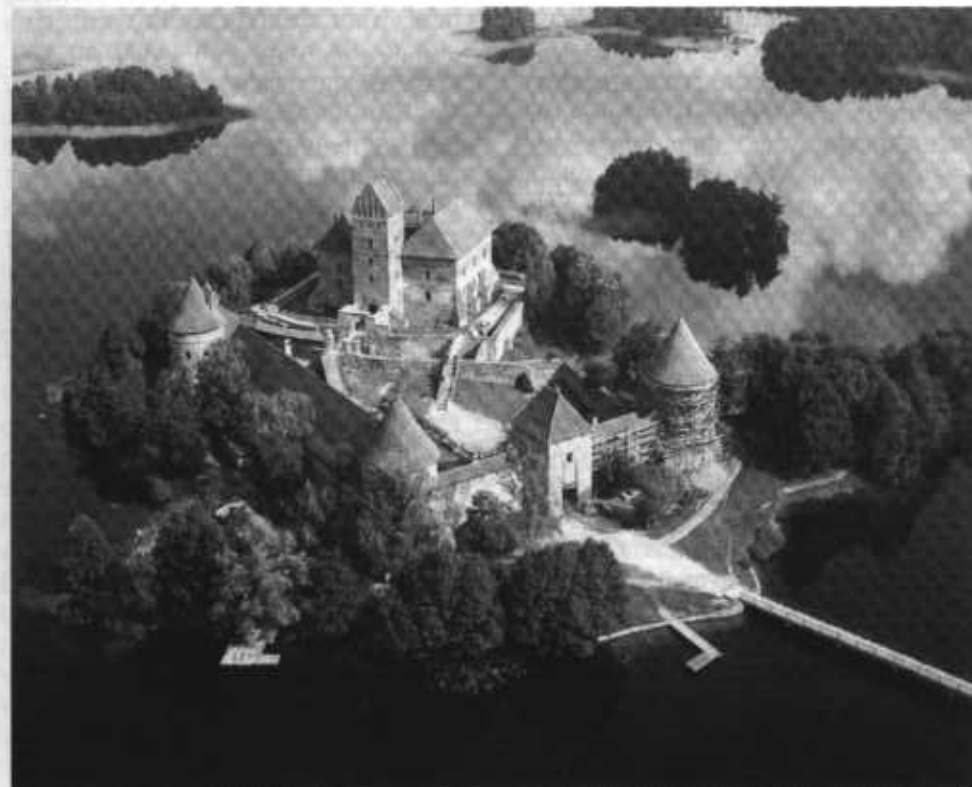
De herstelde waterburcht van Trakai in Litouwen