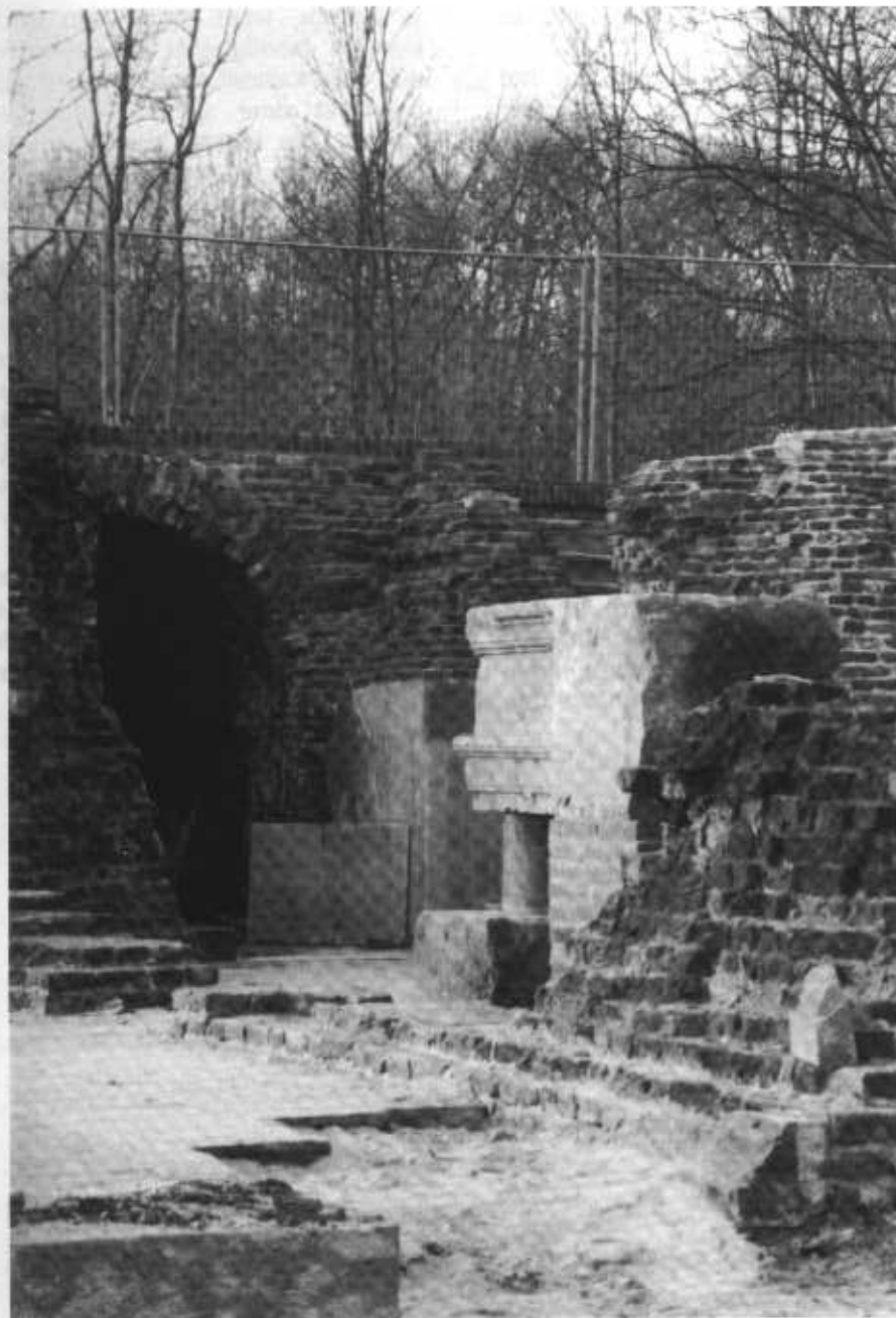
De werkzaamheden in Hemmen naderen hun voltooiing