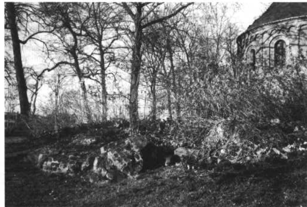
Ruïne met brokken ringmuur vanaf Voerwegzijde

Met dit gegeven heeft de jury bij de beoordeling van de plannen zeer wel rekening gehouden. Gezien het ambtelijk en bestuurlijk voor-overleg dat met de Rijksoverheid was gevoerd, zou met name de interpretatie van Grassi/Barbieri waarschijnlijk op zwaar verzet zijn gestuit waarbij in elk geval met jarenlange slepende procedures rekening had moeten worden gehouden.