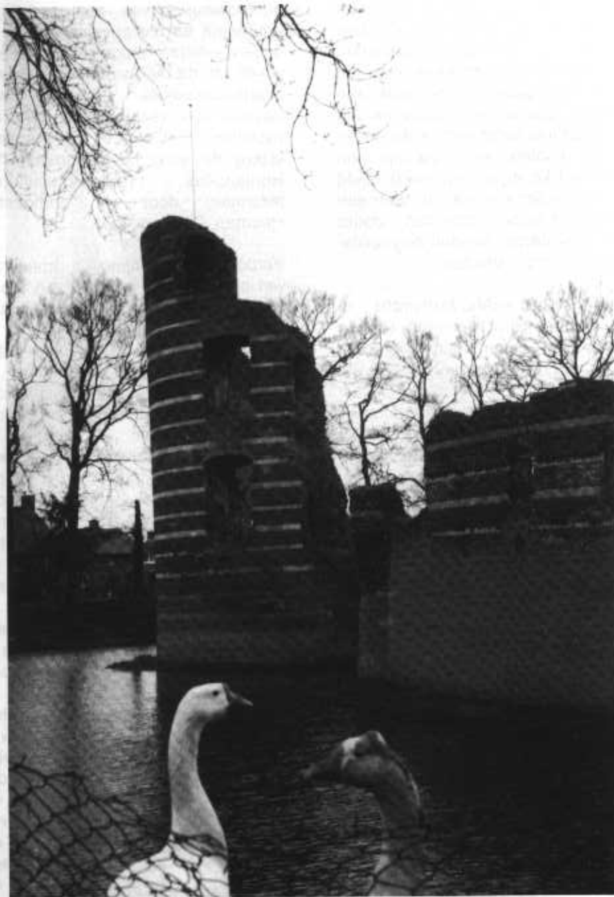
Een deel van de kasteelruïne van Slot Batenburg

van Schevichaven als hij in 1843 de restanten van de burcht bezoekt. Als het aan de ROB ligt, zal het werkverschaffingsproject van 1930/1931 weer ongedaan gemaakt worden. Zover is het nog niet: eerst zal ook hier de bodem onderzocht worden. Zonder dat het hele terrein afgegraven wordt, zal met behulp van grondboringen en geluidspeilingen een duidelijk beeld van de burchtcontouren verkregen worden. Aan de hand van deze resultaten worden de contouren straks duidelijk gemarkeerd en zal er ook nog een informatie-paneel geplaatst worden. Daarmee is Heumen weer een cultuur-monument rijker!