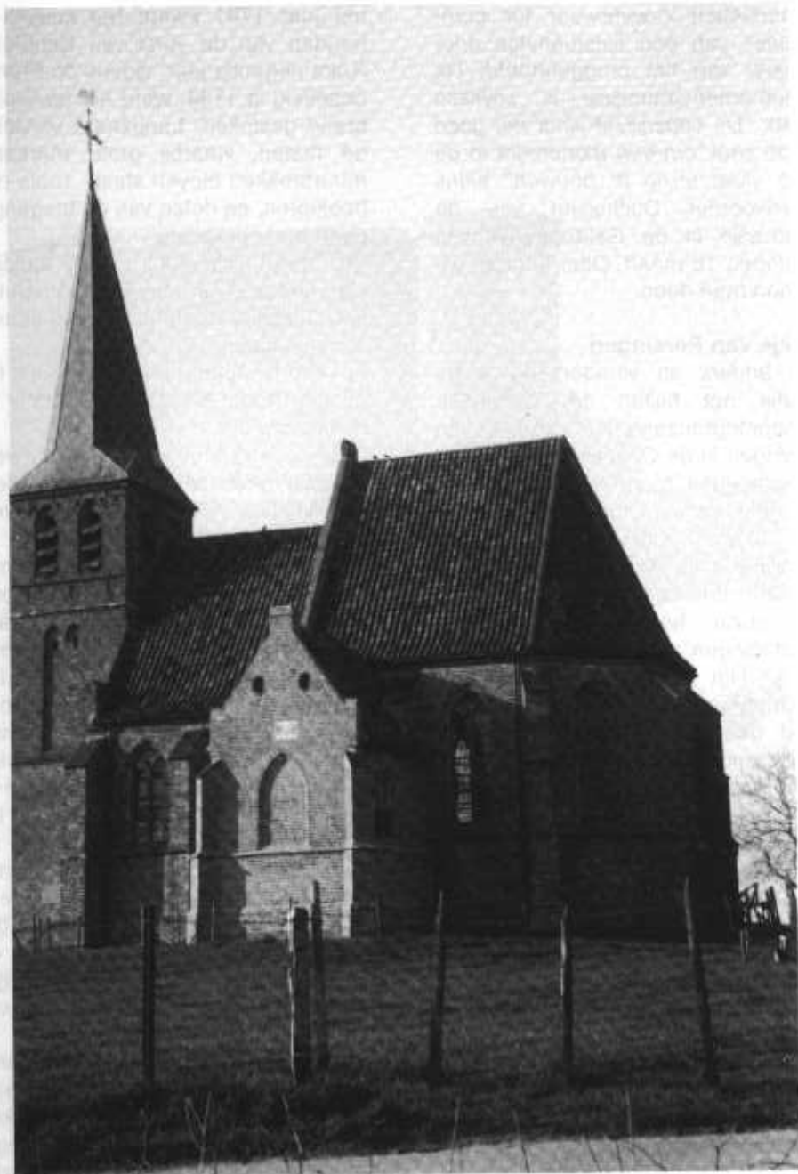
De gereconstrueerde uitbouw van het kerkje in Persingen

Als het aan de Stichting Gelderse Kastelen en de Gemeente Wijchen ligt, komt hier binnenkort verandering in. Er bestaat een uitgewerkt plan om op de binnenplaats een ruïnetuin aan te leggen, waaruit de plattegrond van de verdwenen gebouwen af te leiden is. Het publiek krijgt zo op een aantrekkelijke wijze een goed beeld van geschiedenis en natuur. Voor een aantal praktische problemen, (onder meer vandalisme) moeten nog oplossingen gevonden worden.