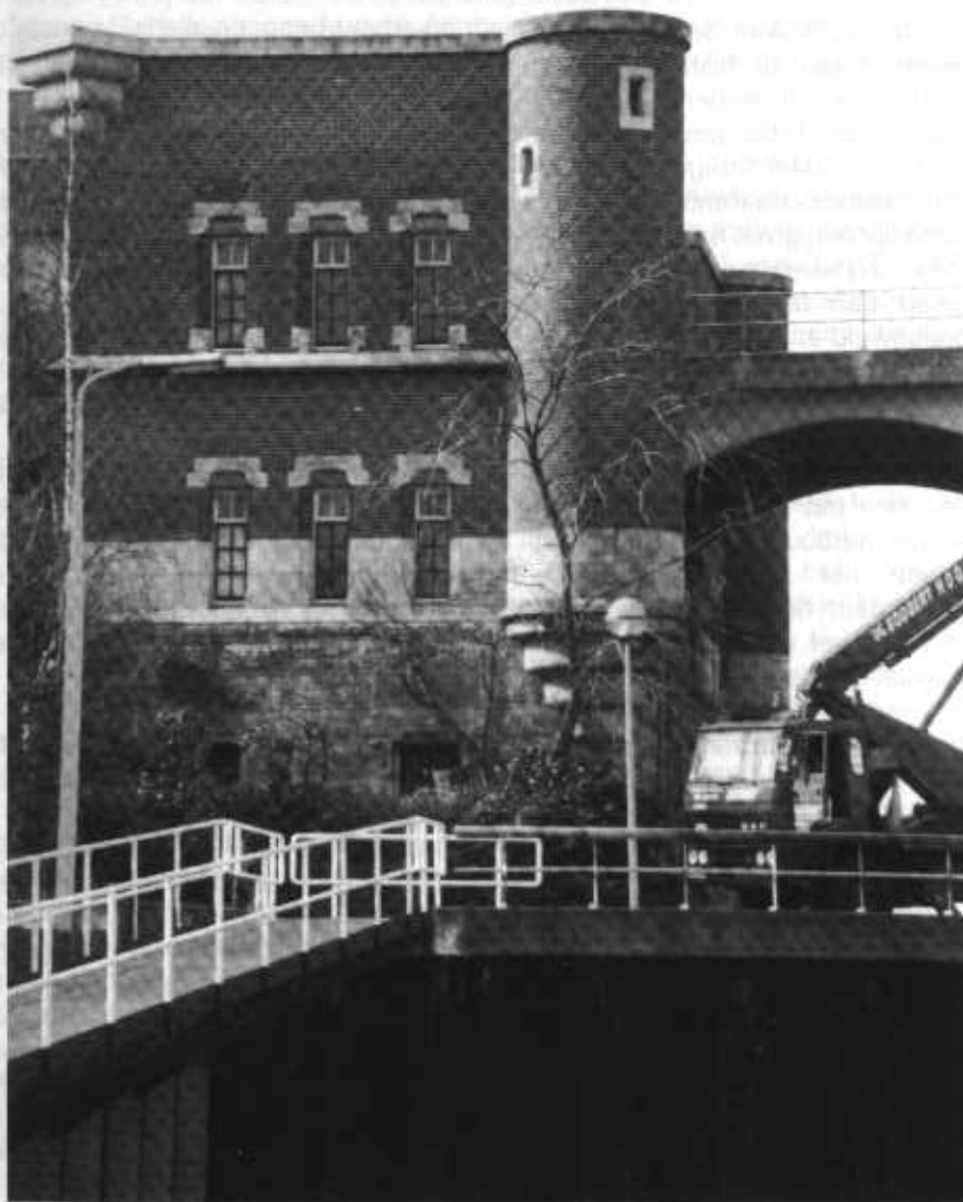
Het eventueel te herstellen bruggenhoofd

te herstellen - weliswaar ter compensatie van een fietstunneltje door de voet van het bruggenhoofd. De Monumentencommissie is sowieso tegen : "De commissie vindt het geen goede zaak om een monument in de oude staat terug te bouwen" aldus woordvoerder Duifhuizen van de commissie in de Gelderlander van afgelopen 18 maart. Daar kunnen we het dan mee doen.