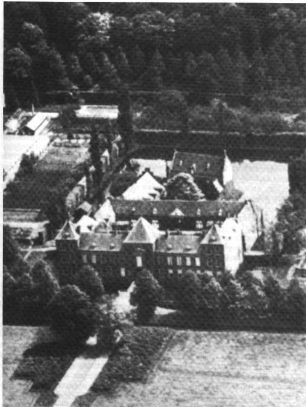
Luchtfoto KLM-Aerocarto van kasteel Heeze en Eymerick.