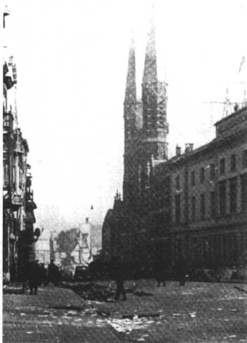
De Molenstraatskerk (Canisiuskerk) op de ochtend na het bombardement. Het middenschip is verdwenen. Nog diezelfde middag werden de torens door de Duitsers opgeblazen.