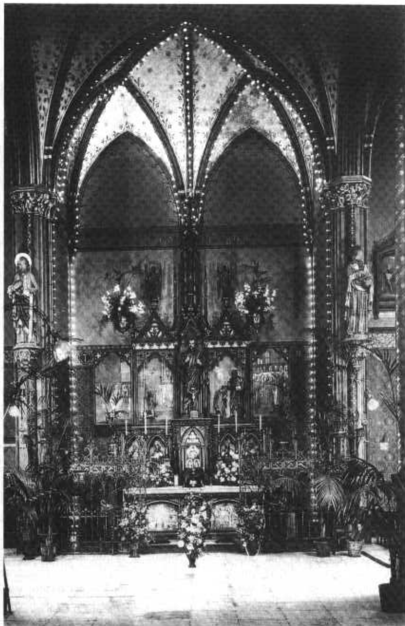
Het tweede altaar 1897(?) - 1933. De reliek "ex ossibus sacrum" van de Zalige Petrus Canisius ligt tentoongesteld op een kussen op het altaarblad.