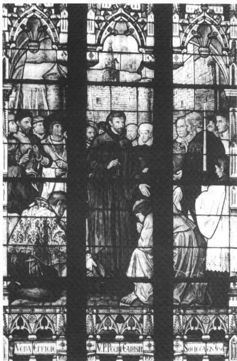
Glas-in-loodraam in de reliekenkapel, voorstellende het bezoek van Canisius aan Nijmegen in 1565. Ontvangst door het stadsbestuur en de geestelijkheid aan de stadspoort.