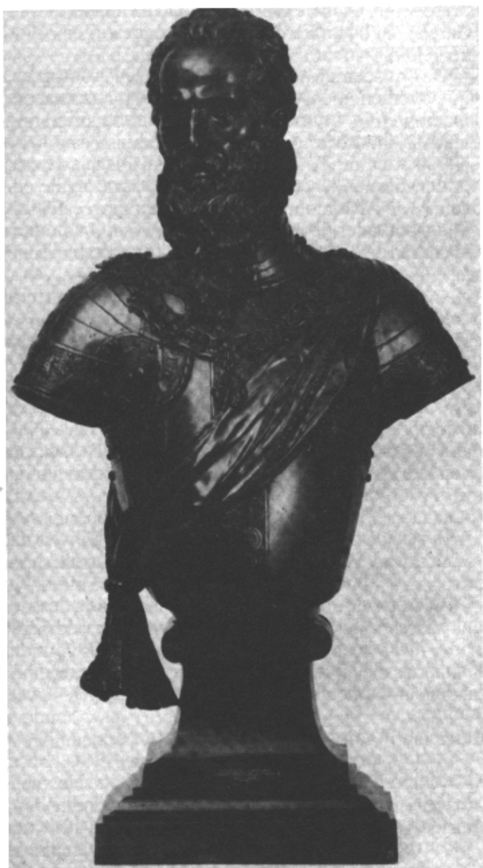
Buste van de Hertog van Alva (Frick Collection, New York).