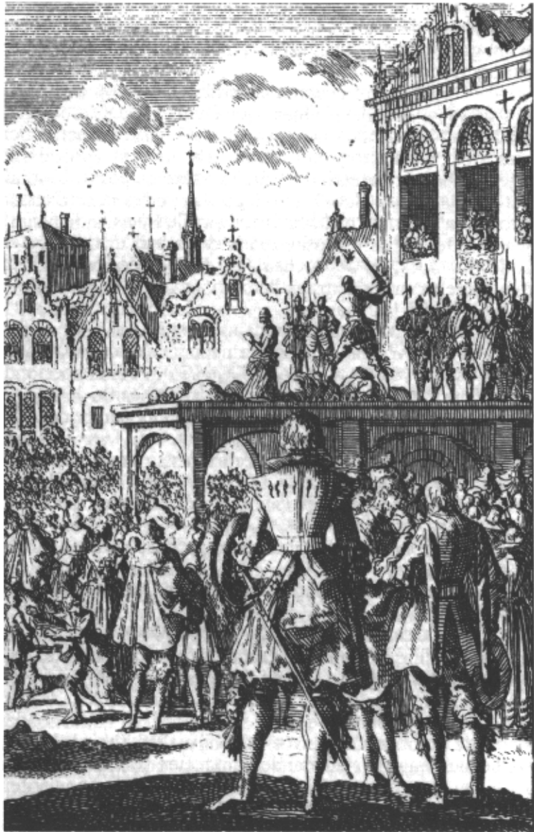
Egmond en Hoorne worden op de markt van Brussel onthoofd op bevel van de Hertog van Alva. Tekenaar onbekend.