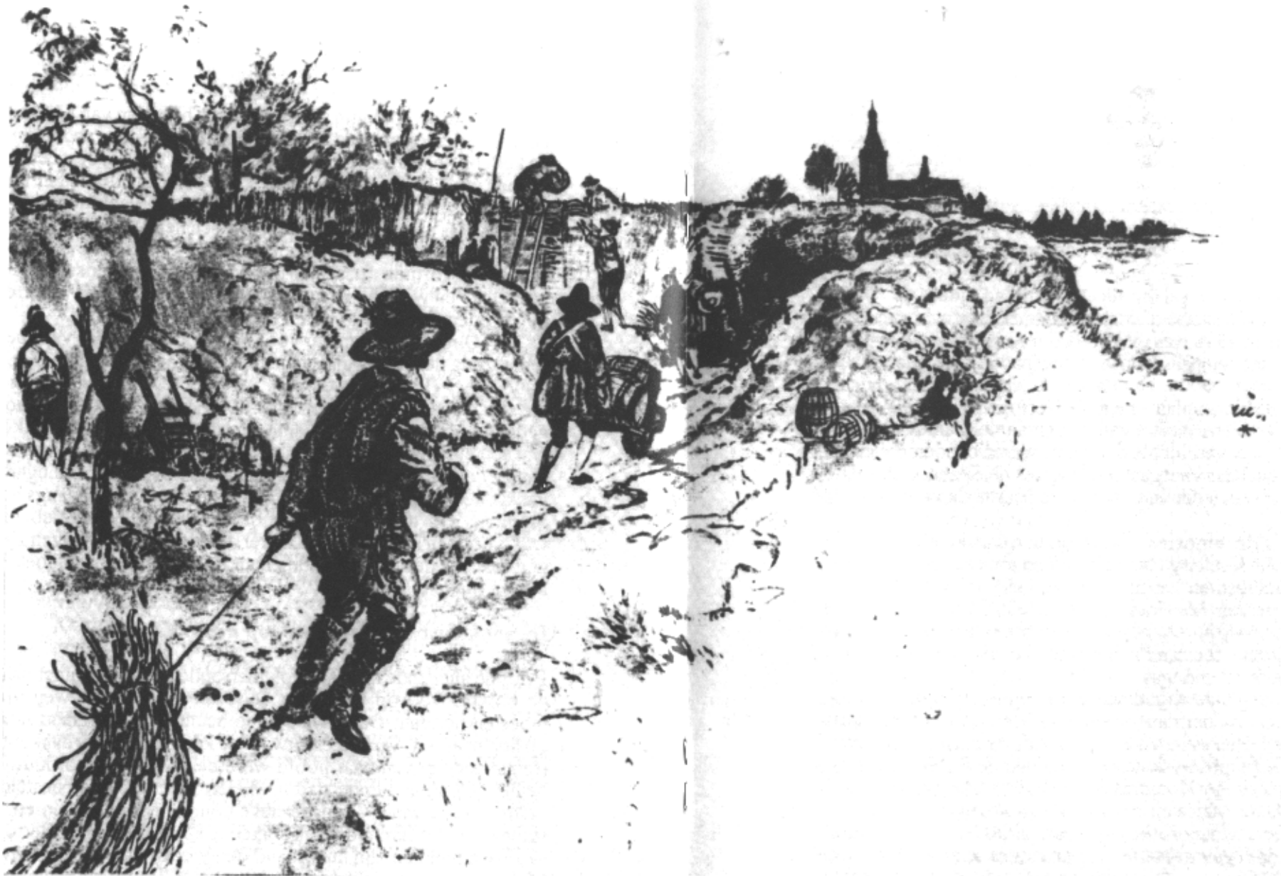
Spaanse soldaten werpen een schans op (tekening Rien Poortvliet).