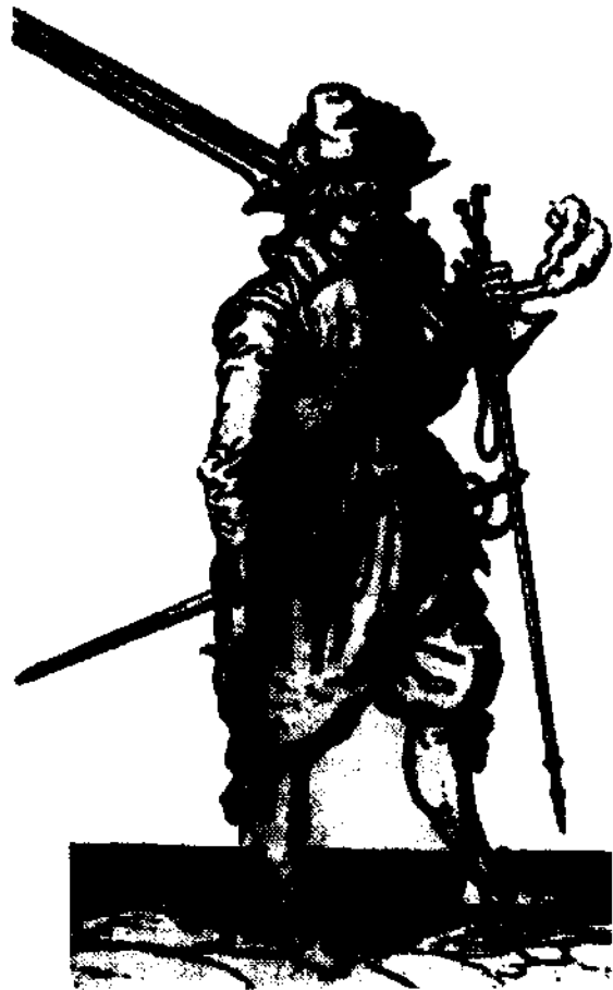
Uitmontering van een soldaat in de Tachtigjarige Oorlog. Pentekening van Jacob de Gheyn, 's-Gravenhage 1607.