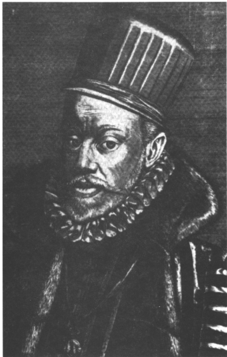
De Spaanse koning Philips II, zoon van keizer Karel V.