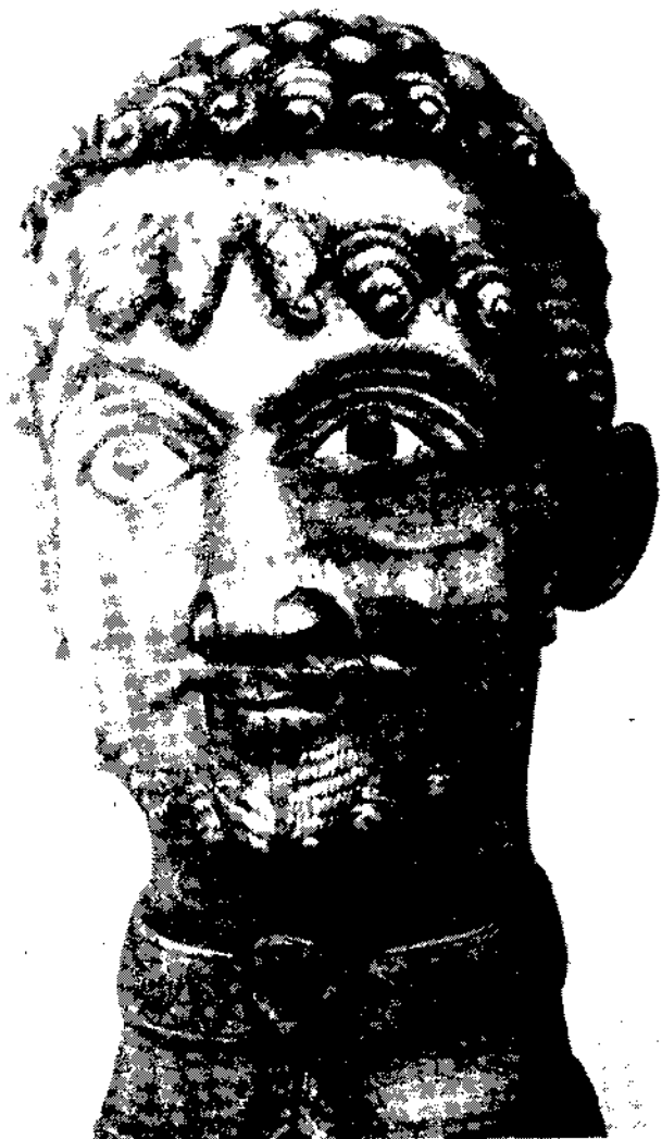
Portret van keizer Frederik I (Barbarossa)