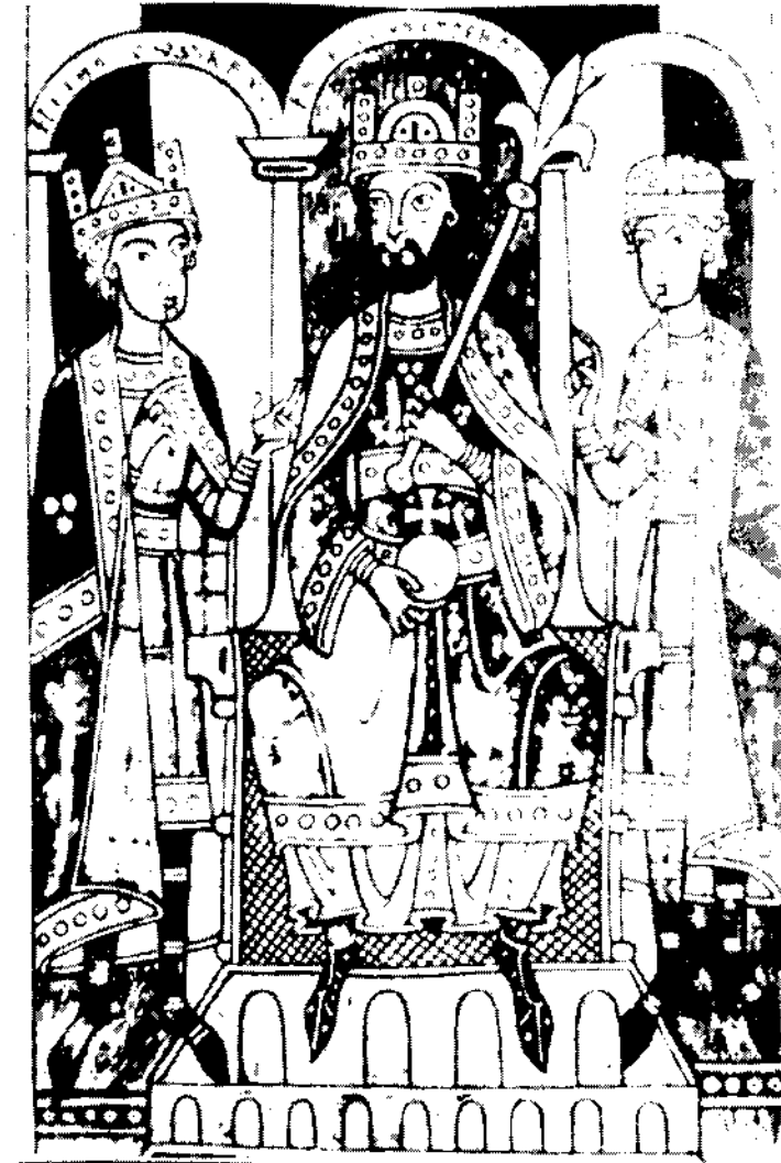
Kroniekblad met een deel van de keizerlijke familie: w.l.g.r.; Hendrik VI, Frederik I, Barbarossa en Frederik hertog van Zwaben. (ongev. 1180)