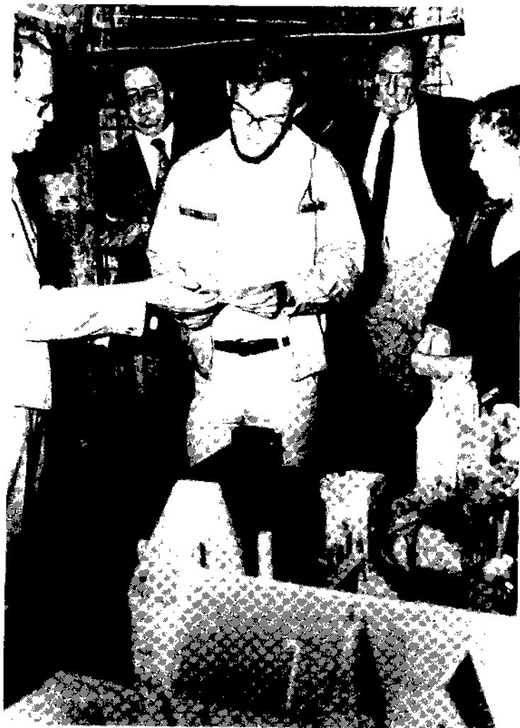
aanbieding van "De Oranjes en het Valkhof" en "Het Bronnentoek" aan de 15000e bezoeker van de Valkhofkapel, Augustus 1961.